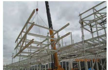
Pipe Rack Coca-Cola Cundinamarca