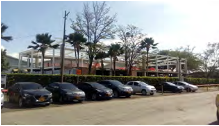
Smurfit Kappa Carton de Colombia Yumbo