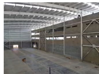
Kenworth de la Montaña Sede Fontibón - Bogotá