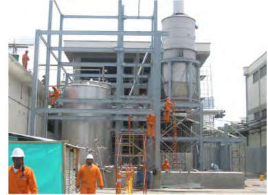
Nestle de Colombia Bugalagrande