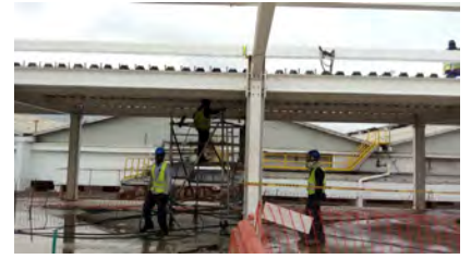
Smurfit Kappa Carton de Colombia Yumbo