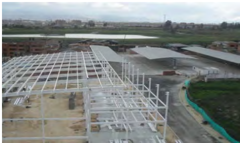
Kenworth de la Montaña Santa Fe de Bogotá