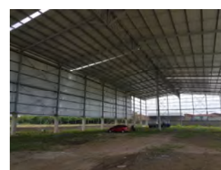
Bodegas Modulares Los Socios Yumbo