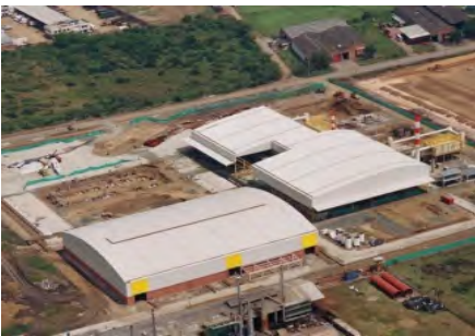
Planta Baterías MAC Yumbo