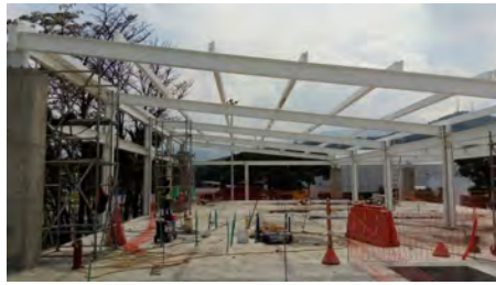
Smurfit Kappa Carton de Colombia Yumbo