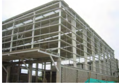
Ampliacion Colombina Malambo-Atlántico