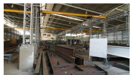
Planta Acycon Estructuras Metálicas Yumbo