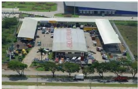
Kenworth de la Montaña Sede Yumbo