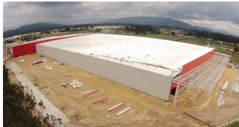
Nueva Planta Coca-Cola - Femsa Tocancipa