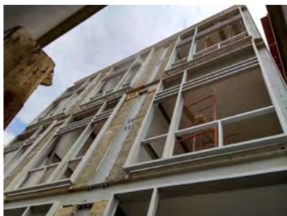
Edificio Loft 38 Santiago de Cali