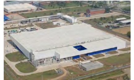
Nueva Planta Postobón Yumbo