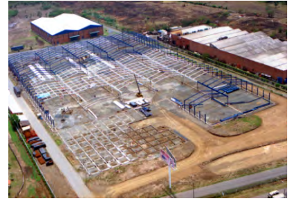
Planta Comestibles Aldor Yumbo