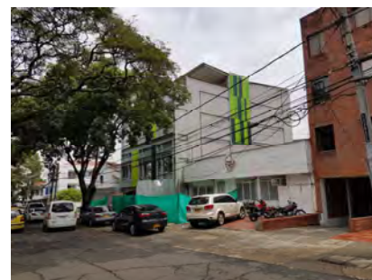
Edificio Loft 38 Santiago de Cali