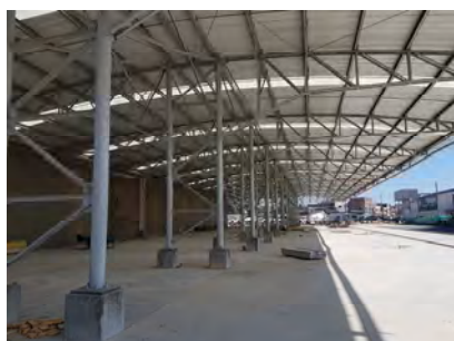
Kenworth de la Montaña Sede Fontibón - Bogotá