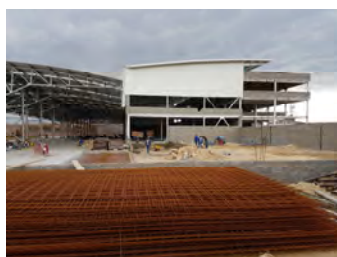
Kenworth de la Montaña Sede Fontibón - Bogotá