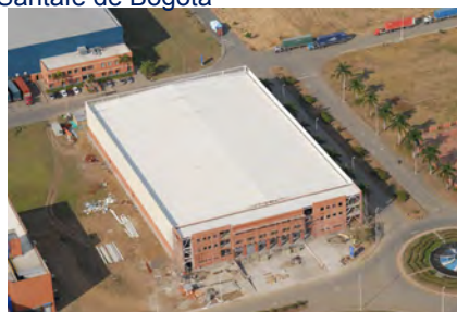
Fogel Andina-Zona Franca del Pacifico Palmira