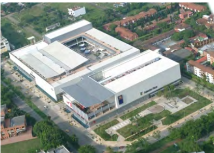
Centro Comercial Palmetto Plaza Santiago de Cali