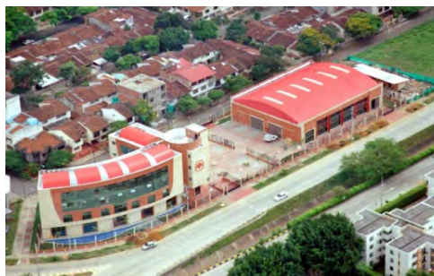
Mapfre Seguros de Colombia Santiago de Cali