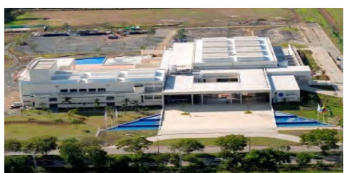
Centro de Eventos Valle del Pacifico Yumbo