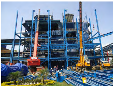
Ampliacion Edificio Destileria Incauca Caloto Cauca