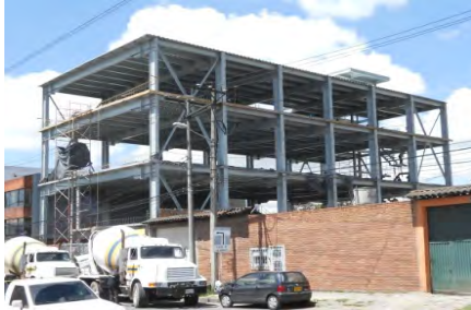
Edificio Bogotana de Textiles Santafé de Bogotá