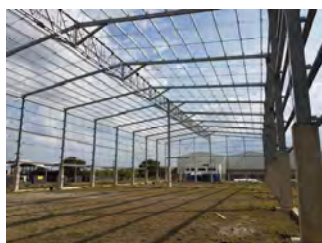
Bodegas Modulares Los Socios Yumbo