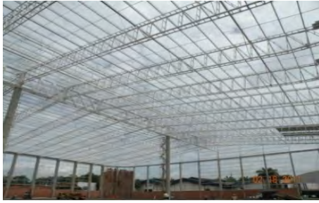
Prodispel Etapa 3 Caloto Cauca