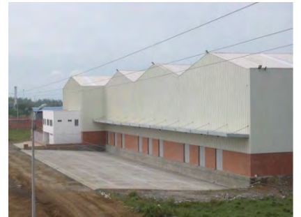
Kenworth de la Montaña-Bodega Sede Yumbo