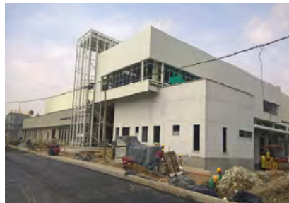
Imusa Groupe SEB Rio Negro - Antioquia