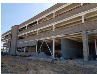
Kenworth de la Montaña Sede Fontibón - Bogotá