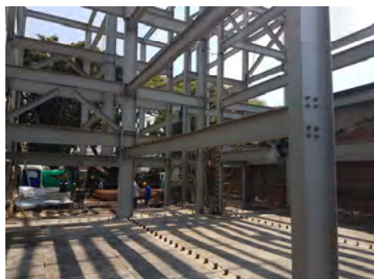
Edificio Loft 38 Santiago de Cali