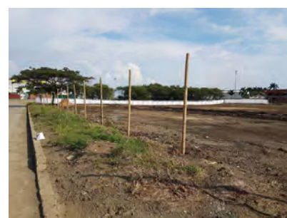
KW Commercial Zone Yumbo