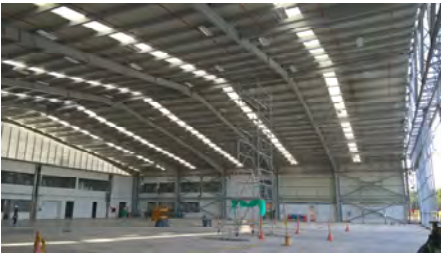
HANGAR Interejecutiva de Aviacion Rio Negro - Antioquia