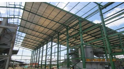
Palmas del César San Alberto César